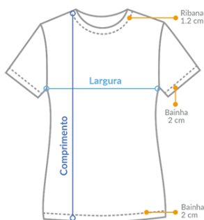
Tabela de medidas Feminina